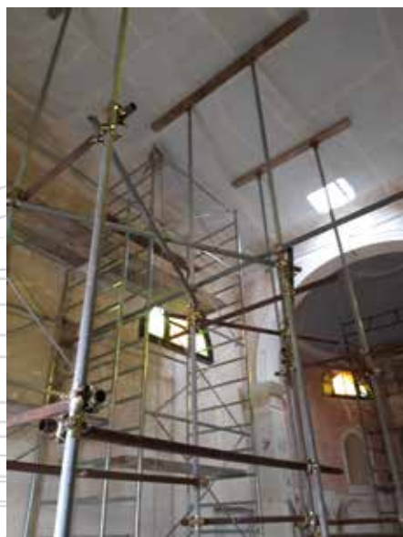
Consolidamento del controsoffitto della chiesa