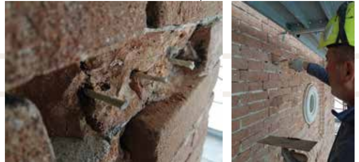
Ricostruzione di mattoni con impernature