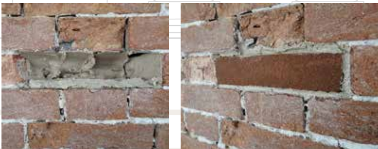
Fase di innesto di mattoni nel paramento murario a vista