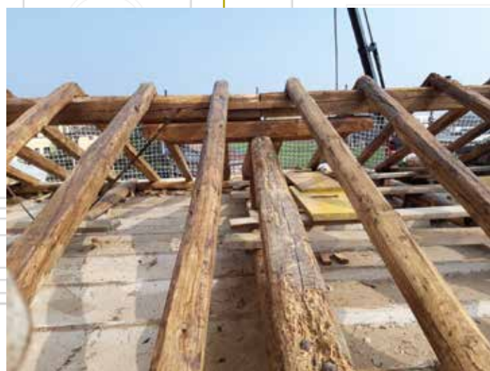
Pulizia e trattamento delle strutture lignee portanti