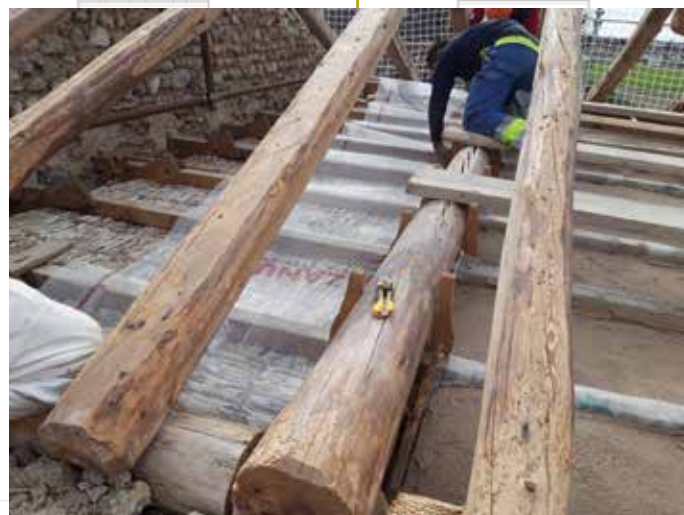
Riposizionamento delle tavelline originarie