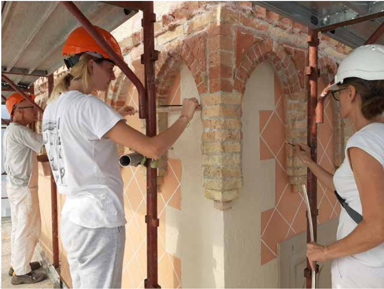
Particolare degli interventi sulla torre di stile neo gotico