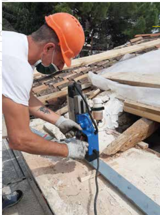
Posa in opera del ferro piatto sulla cornice perimetrale della chiesa