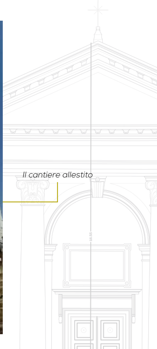
Il cantiere allestito