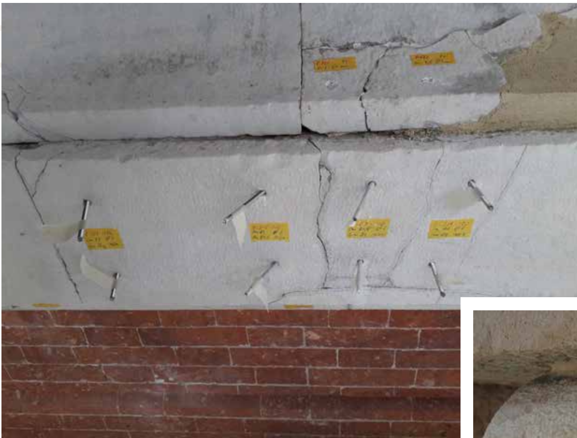
Consolidamento di elementi lapidei: cornici e modiglioni