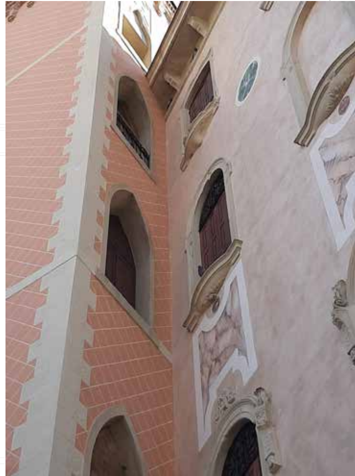
Particolari dell'apparato decorativo