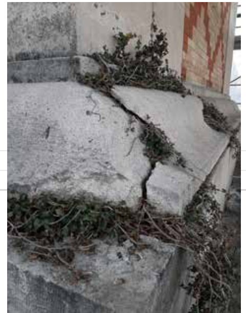
Fasi di stuccatura degli elementi lapidei