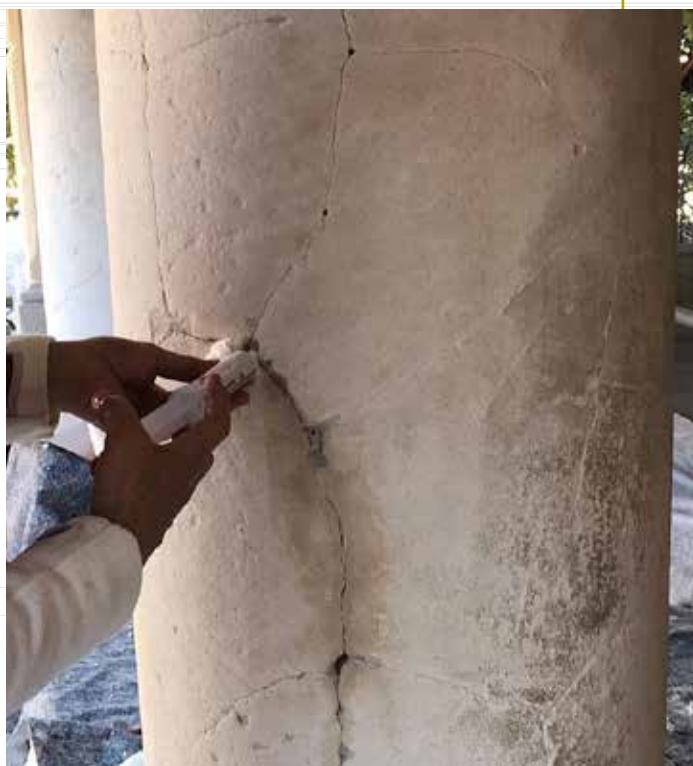
Consolidamento dell'intonaco mediante iniezioni di maltina di calce