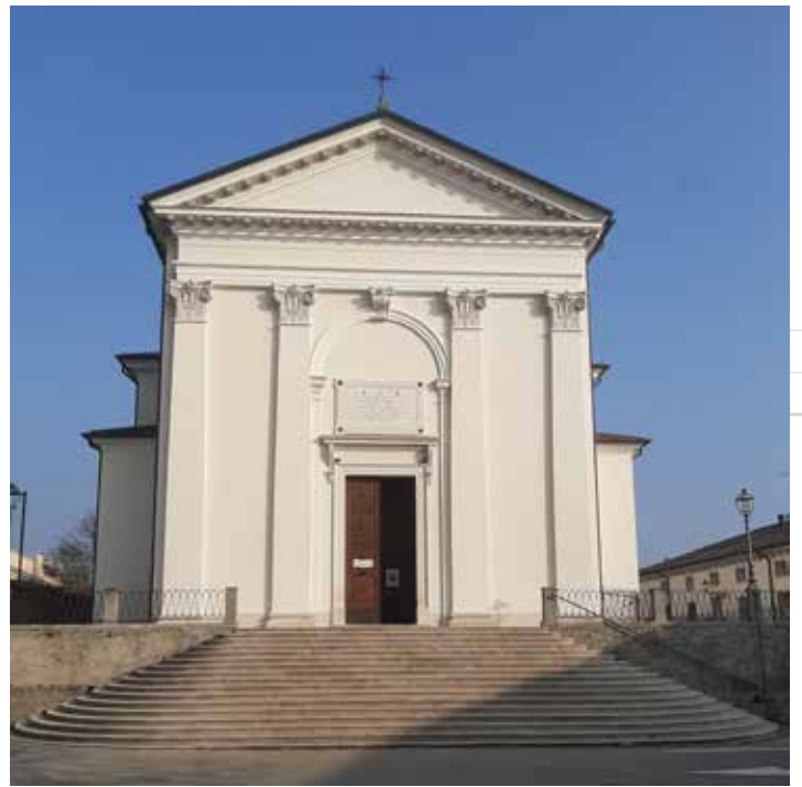
La facciata principale a restauro concluso