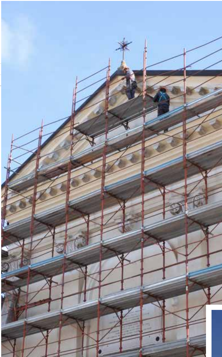
Cantiere in allestimento